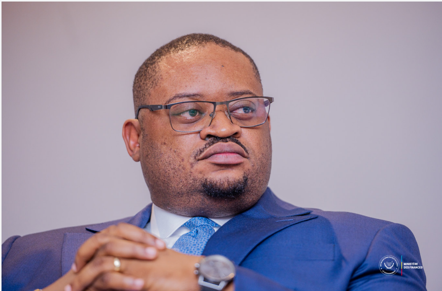
Son Excellence Monsieur le Ministre des Finances, Doudou FWAMBA LIKUNDE LI-BOTAYI

UNE NOUVELLE ÈRE POUR LA GOUVERNANCE DE NOS FINANCES PUBLIQUES